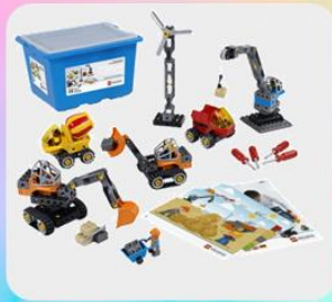
Набор «Строительные машины»