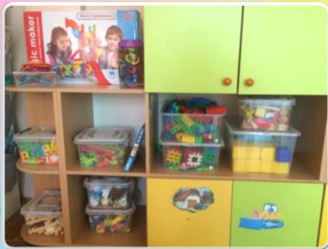
Центр конструктивных игр 4-5 лет