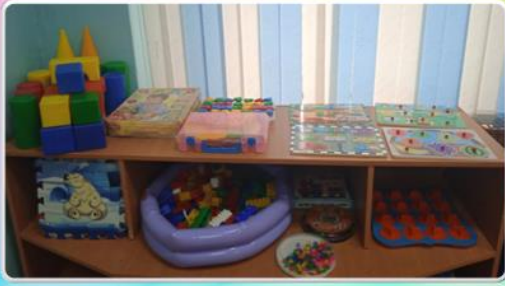
Центр конструктивных игр 2-3 года