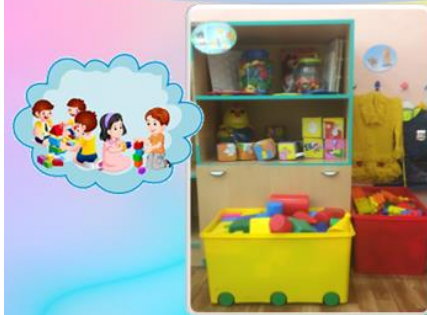
Центр конструирования игр 3-4 года